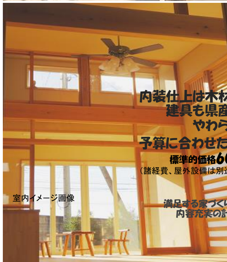
室内イメージ画像

[例] 土地105坪 建物36坪 諸経費 予算総額 460万 + 2,340万 + 200万 = 3,000万 土地は非課税、建物、諸経費税込 諸経費、利率は融資等の条件により変わります。 自己資金200万 融資2,800万 融資利率0.9% 30年 88,778/月